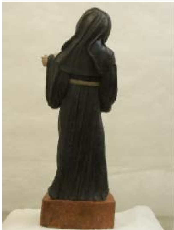
Peça finalizada - 20/12/08

Restauro de jogo de xadrez em alabastro restaurada comjato a lazer – Ateliê particular S. Paulo – SP.