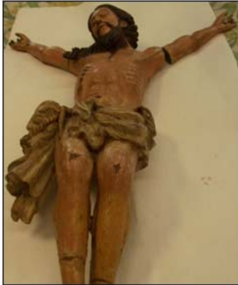
Antes: foto de 05/01/09 Autor: Eneida Verri Bucco

Fotos do trabalho de restauração de crucificado, escultura em madeira (cedro) policromada realizada durante estágio no Museu da Inconfidência – Ouro Preto – MG - para conclusão do Curso da FAOP – Fevereiro 2.009 - fotos: Eneida Verri Bucco Oliveira