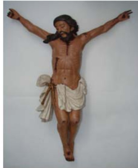
Depois: foto de 28/02/09