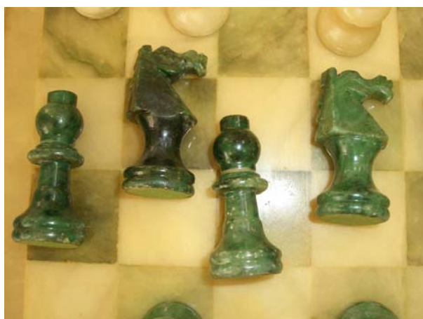
Antes: perdas no alabastro 10/03/09

Restauro de jogo de xadrez em alabastro restaurada comjato a lazer – Ateliê particular S. Paulo – SP.