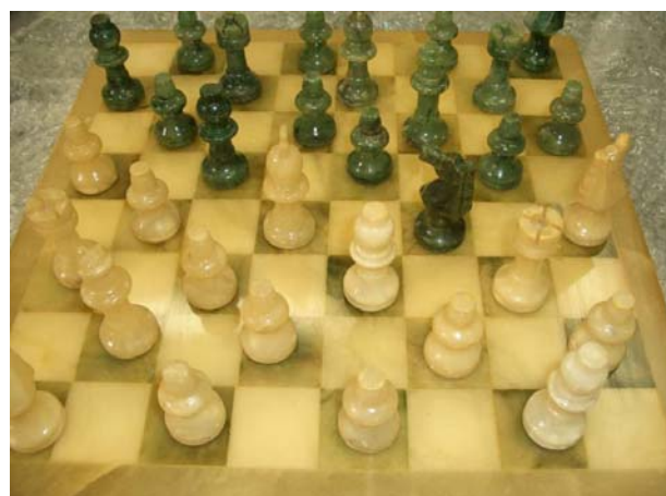
Peça finalizada 18/04/09